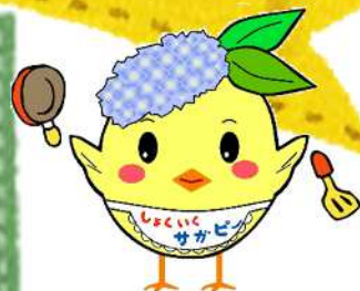
相模原市食育推進 マスコットキャラクター サガビー